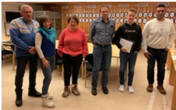
Fra samarbeidsmøtet med kommunen i 2021.

I prosessen med kommuneplanens arealplan har vi spilt inn at idrettsrådet ønsker å bli involvert i det videre arbeidet for å ivareta idrettens interesser og fremtidige arealbehov, men vi er foreløpig ikke involvert. Kommunen er forsinket med igangsetting av arbeidet med ny kommunedelplan for fysisk aktivitet, idrett mv . Vi har pr nå ikke info om når arbeidet igangsettes.