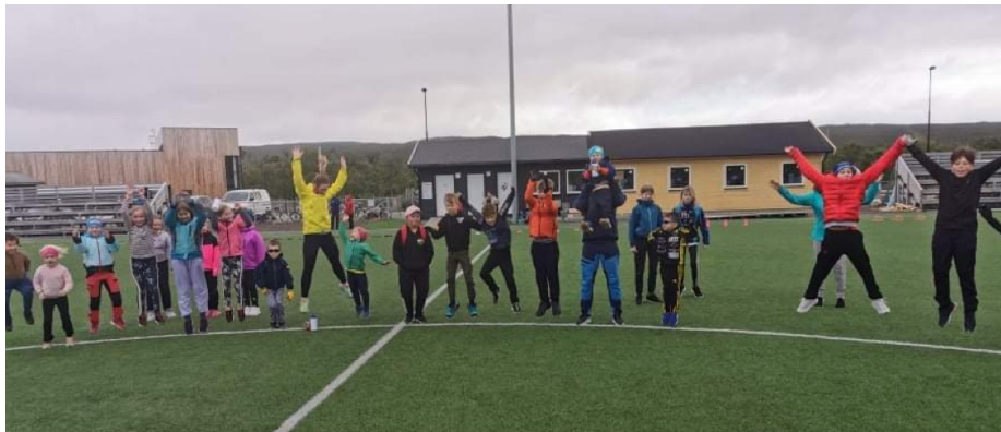
Fra aktivitetsuka 16.-19. august 2021.

NIF mistet 185.000 medlemsskap i løpet av 2022. I Tana har det også vært nedgang i antall medlemmer i pandemi-årene. 2021: 1.161, 2020: 1.147 og 2019: 1.354 medlemmer i idrettslagene, dvs. 15% nedgang fra 2019 til 2020, og 3 idrettslag hadde mer enn 25% nedgang; Bryteklubben, TBK og motorklubben. Medlemstallene og aktivitetene går nå rett vei, men vi deler samme bekymring som idretts-Norge generelt; får vi barna og unge tilbake til idretten?